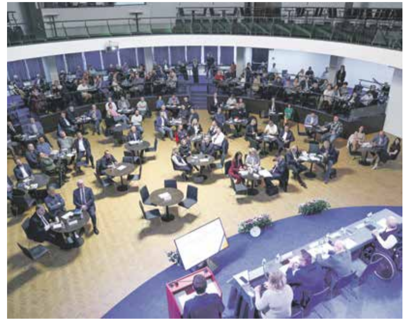
Konference místních samospráv přilákala desítky starostů. Poslechli si novinky z oblasti dotací, zdravotnictví nebo školství.

„To je pro zástupce měst a obcí zdarma. Odborníci z Energetického centra Olomouckého kraje starostům