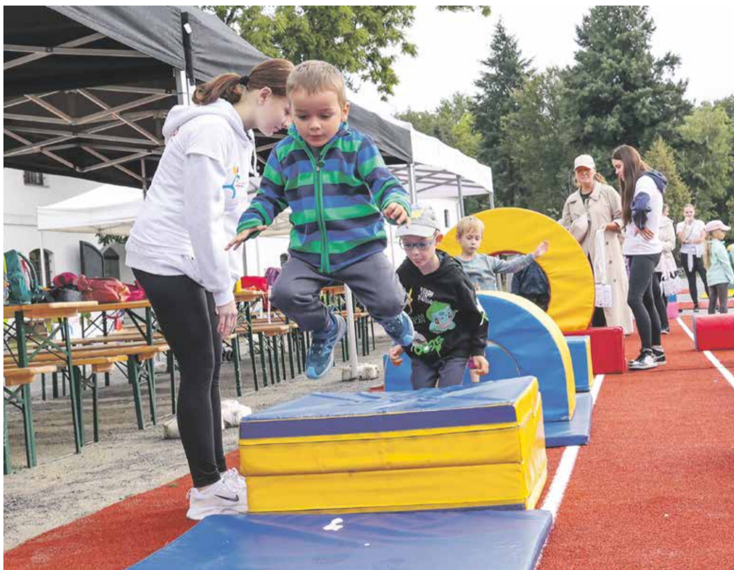
Krajská podpora na rozvoj sportu v regionu jde ruku v ruce s novou strategií Olvie. Působit chce už od nejmenších sportovců.