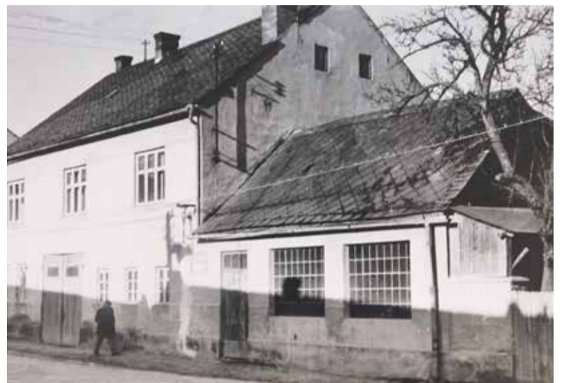
Dům a kovárna rodiny Schreiberových ve Vranové Lhotě.

v listopadu 1989 inicioval vznik Občanského fóra na pracovišti. Aktivně oslovoval kolegy a připomínal jim události roku 1968. OF následně zakládal i ve Vranové Lhotě.