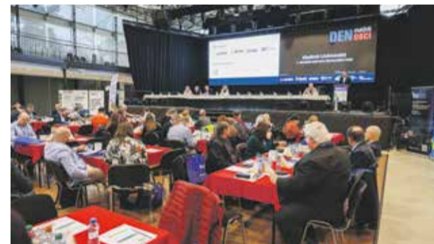
Den malých obcí pravidelně přináší diskuze o tom, co je pro starosty a zástupce obcí aktuální.