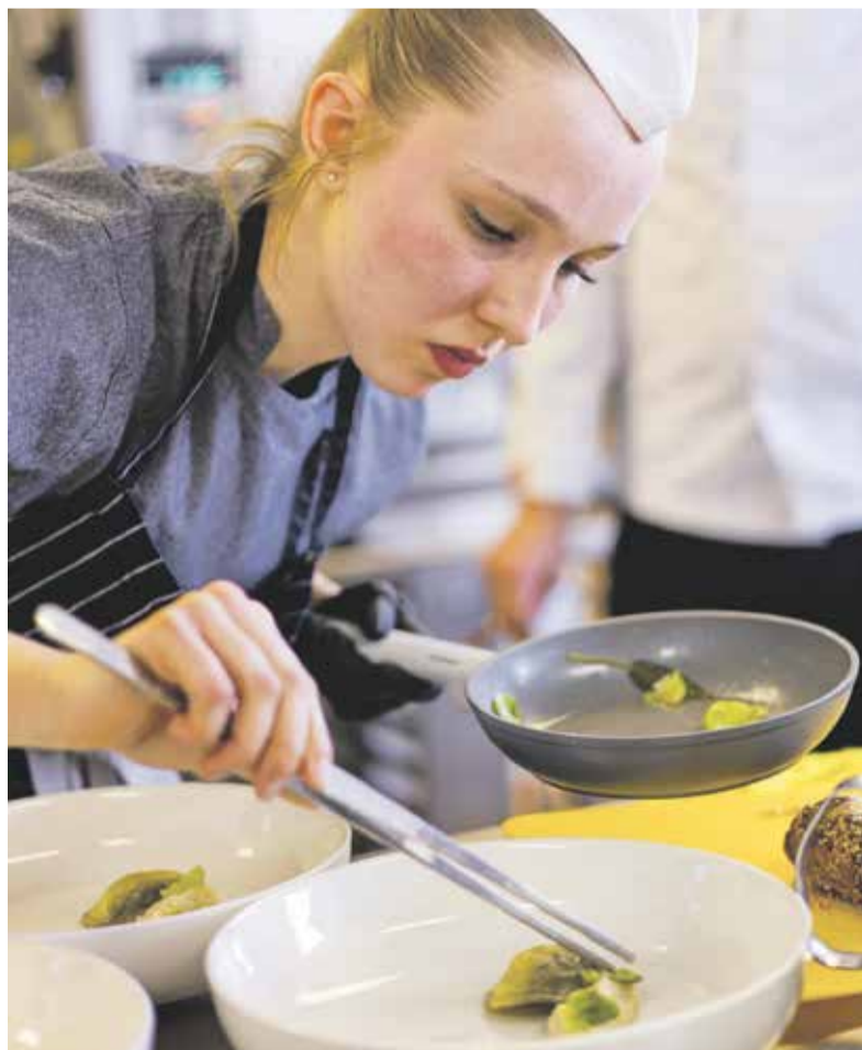
Soutěž mladých kuchařských i baristických talentů se konala v dubnu v Přerově. Porotě svůj um předvedly desítky přihlášených studentů.