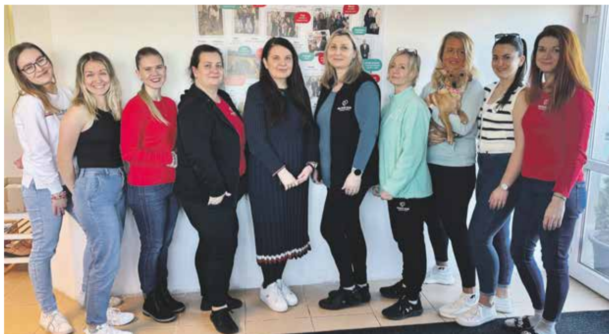
Členky týmu mobilního hospicu pečují o pacienty do posledních chvil. V rámci své činnosti pracují i s ostatními členy rodiny.

Jsme mobilní hospic Nejste sami a pečujeme o nevléčitelně nemocné, kteří si přejí v závěru svého života zůstat doma. Působíme v Olomouci a okolí. Pomáháme dětem i dospělým prožít závěr života v prostředí, které znají, s lidmi, které milují. Poskytujeme odbornou zdravotní i sociální péči. O pacienty a jejich blízké se stará