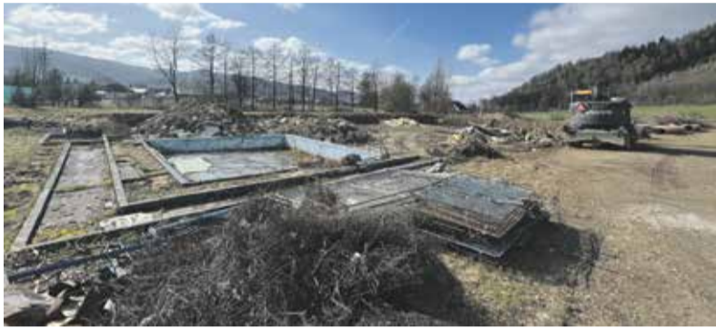
Staré koupaliště v Rapotíně nahradí nový přírodní biotop.