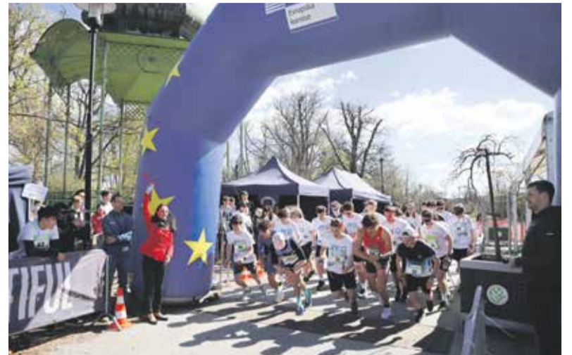
Mladí závodníci ve štafetovém závodu zdolali trasu maratonu. Nejlepší týmy postoupily do celorepublikového finále.

Pokud přihlášený tým tuto podmínku nesplnil, směl se krajského semifinále účastnit, ale neměl pak nárok na postup do finálového celorepublikového kola. To se bude konat 3. května v rámci Pražského mezinárodního maratону.