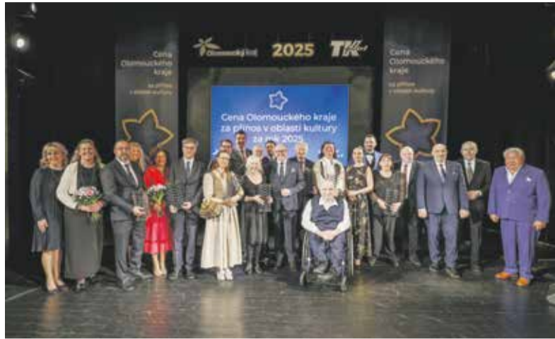
19. ročník udílení cen vyzdvihl deset osobností a počínů z oblasti kultury v Olomouckém kraji.

Návrhy předkládaly fyzické i právnické osoby od loňského prosince do letošního ledna. Cenu hejtmána Olomouckého