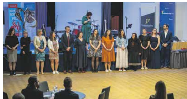
Poděkování pěstounům prostřednictvím Předmájové veselice se koná od roku 2023 a má vždy pozitivní odezvu.

Cílem Předmájové veselice, která se koná pravidelně od roku 2023, je poděkovat pěstounům a pracovníkům doprovázejících organizací za jejich každodenní práci, péči, nasazení a podporu. Na akci dorazilo na 250 lidí, a to