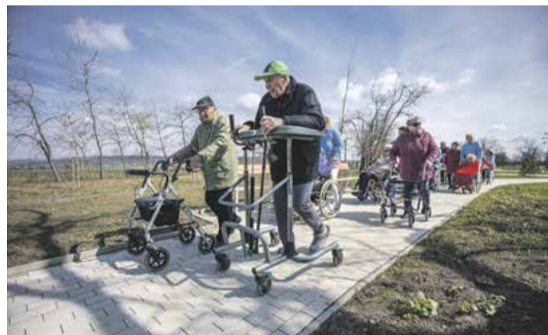
Nové chodníky, mobiliář, osázení dřevinami i květinami a upravené trávníky. To vše dělá ze zahrady domova pro seniory ve Chválkovicích příjemnější místo.

Nového řešení zahrady Domova pro seniory Pohoda v Olomouci-Chválkovicích si mohou jeho klienti i návštěvníci užívat díky kompletní renovaci. Slavnostní