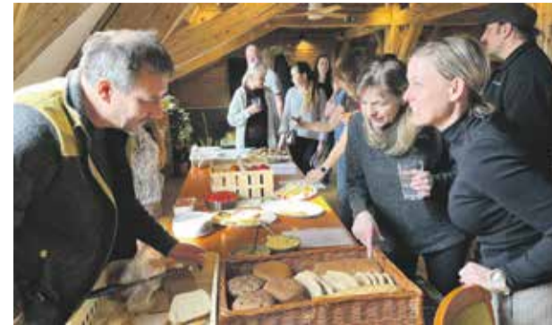
Cílem projektu Od vidlí po vidličku je dostat lokální potraviny z farem přímo do jídelen.