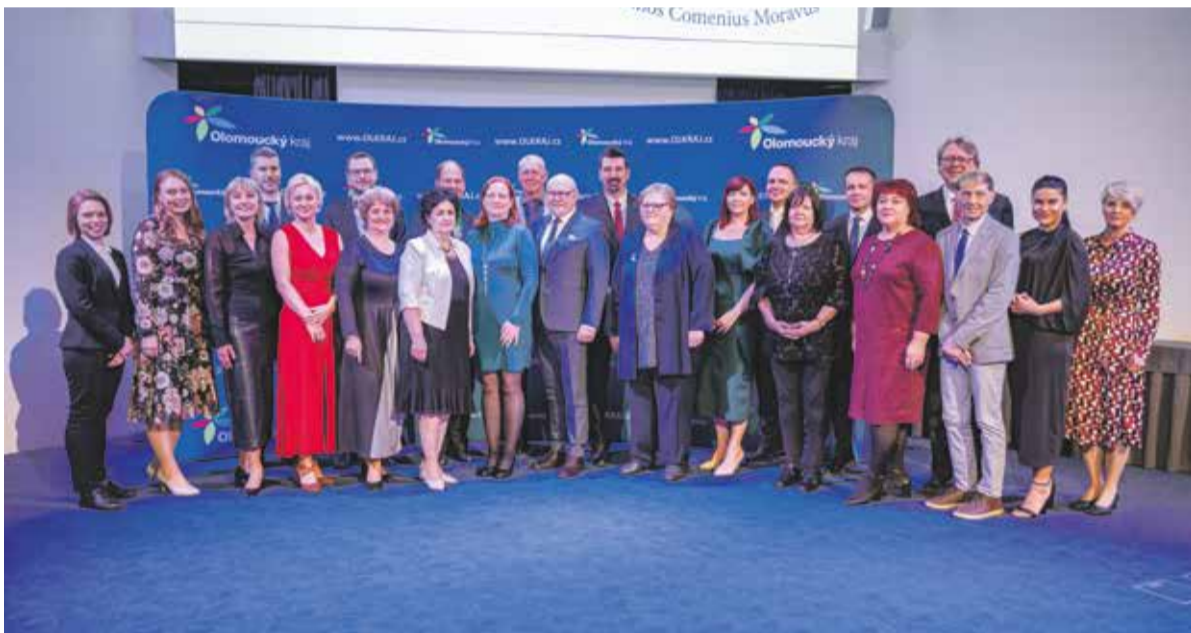
Dvacet jedna osobností získalo ocenění Učitel roku Olomouckého kraje 2026 .