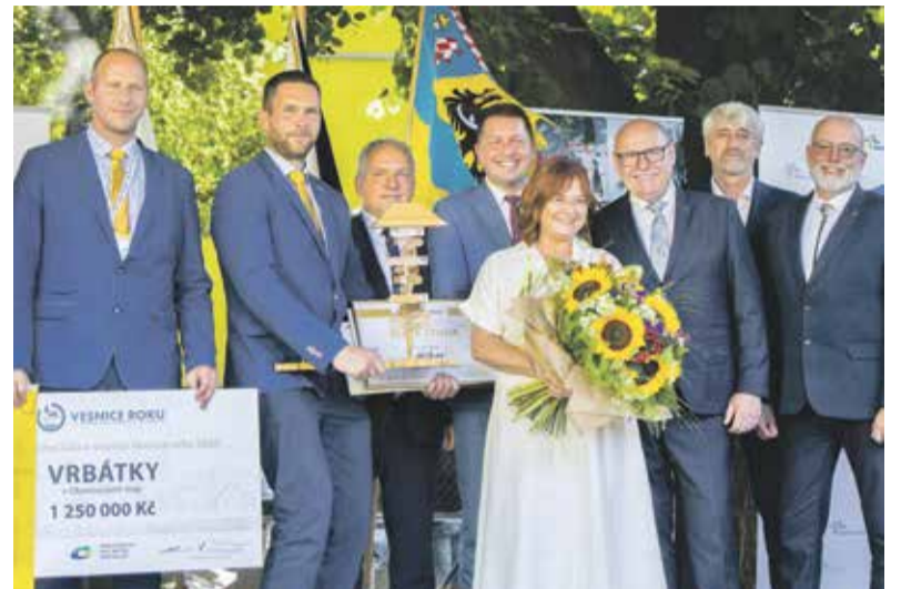
Vítězem v krajském kole soutěže Vesnice roku 2025 se staly Vrbátky.

Soutěž letos slaví třicátiny narozeniny a patří mezi nejoblíbenější aktivity podobného typu v regionu i v celém Česku. Přihlášené vesnice hodnotí zvlášť sestavená komise, která si všimá třeba toho, jak obce podporují společenský život, pečují o zeleň, veřejná prostranství nebo jak investují do obecního majetku.