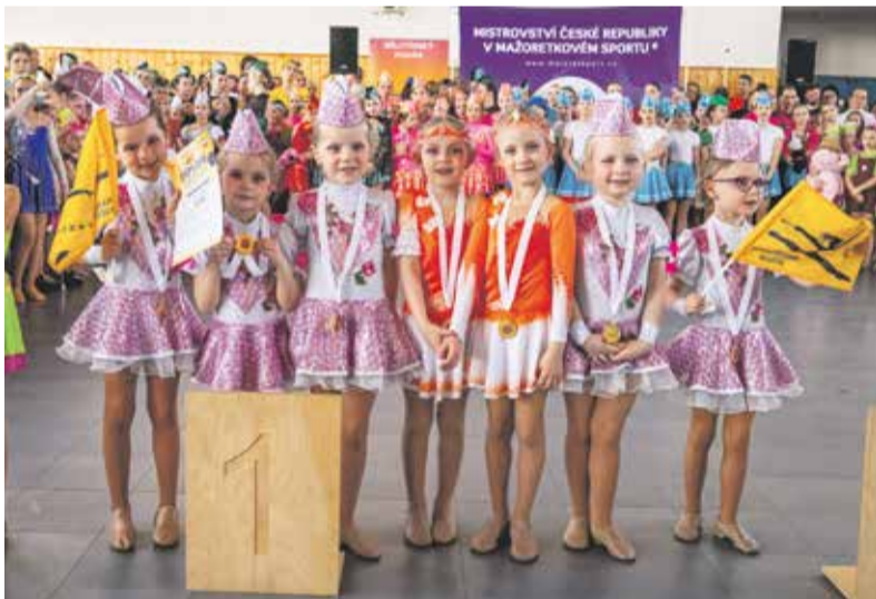
Nechyběly mažoretky z nejmladších věkových kategorií.

Předkolo 33. ročníku Mistrovství České republiky v mažoretkovém sportu se konalo o víkend 14. a 15. března v Bělotíně na Hranicku. Soutěže známé jako Bělotínský pohár se účastnily mažoretky z celé republiky.