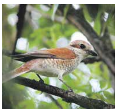
Samice tuháky obecného.