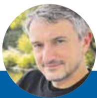
Michal Poštulka starosta Troubelice