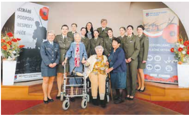
Setkání s názvem OdvaHa má ženskou tvář propojilo hned několik generací žen, kterým je blízká činnost v armádě.