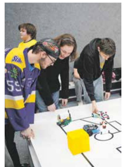
Více než stovka studentů se utkala v rámci soutěže s programovatelnými roboty Robotix.