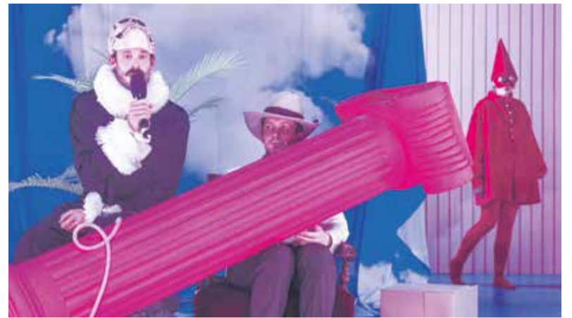
Oidipus Utopia, Činoherní studio Ústí nad Labem.