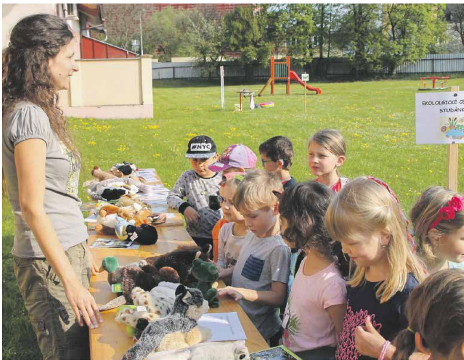
Hejtmánství přispívá i na vzdělávací programy pro děti.