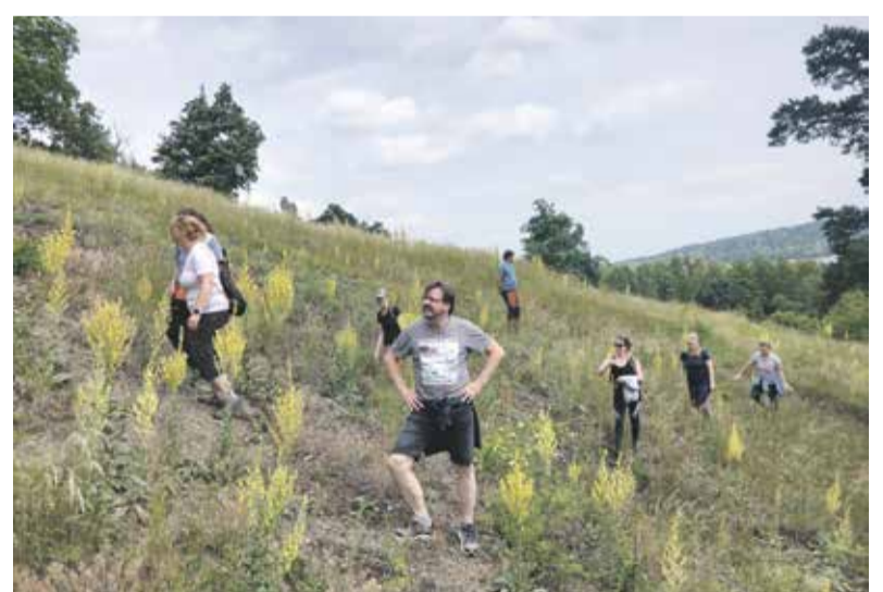
Exkurze v přírodní památce Čubernice. (nahore) Výhrůžný postoj kudlanky. (vlevo)

Při péči o Čubernici je dbáno na pravidelnou mozaikovitou seč, při které jsou vynechávány zachoňující plošky a místa s výskytem chráněných