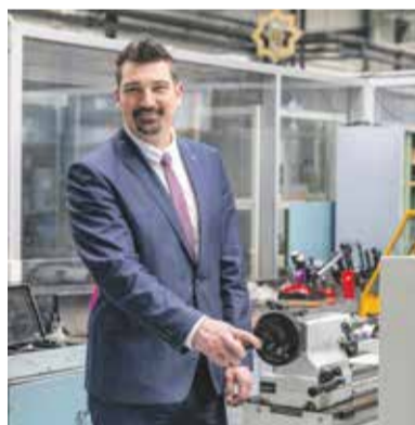
Novou odbornou učebnu si v Lutíně prohlédl i náměstek hejtmana Svatopluk Binder.

Kompletní rekonstrukci za více než devět milionů korun prošlo sociální zařízení domova mládeže ve všech patrech budovy. V místnostech jsou nové obklady, podlahy, ale také rozvody vody a mobiliář. Další dokončenou investiční akcí za více než