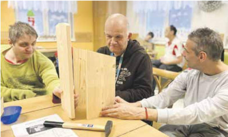
Klienti mají v centru mnoho aktivit. V lednu stavěli krmítka pro ptáky.

Radní Olomouckého kraje schválili plán transformace Centra Dominika Kokory, které poskytuje služby klientům se zdravotním postižením. Jde o první krok k tomu, aby hejtmanství mohlo na realizaci