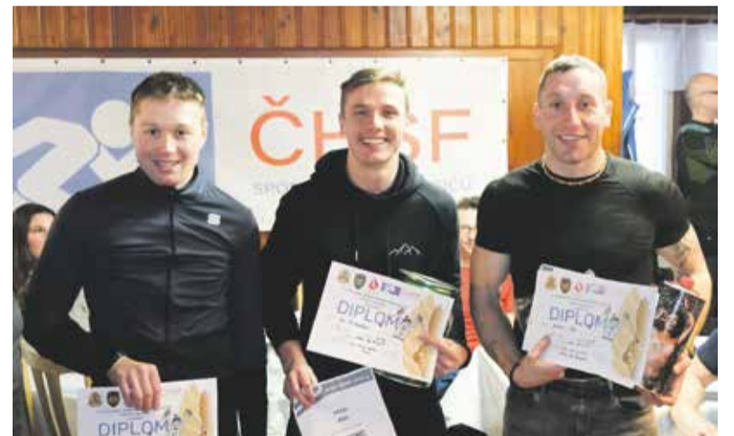
Hasiči z Jesenicka úspěšně reprezentovali svoje stanice v Jizerských horách.

Celkově na trať vyběhlo sedm příslušníků Hasičského záchranného sboru (HZS) Olomouckého kraje. Sedmáctý ročník soutěže pro příslušníky a zaměstnance HZS ČR se konal na konci ledna. Oblíbeného závodu v běžeckém lyžování volnou technikou se letos