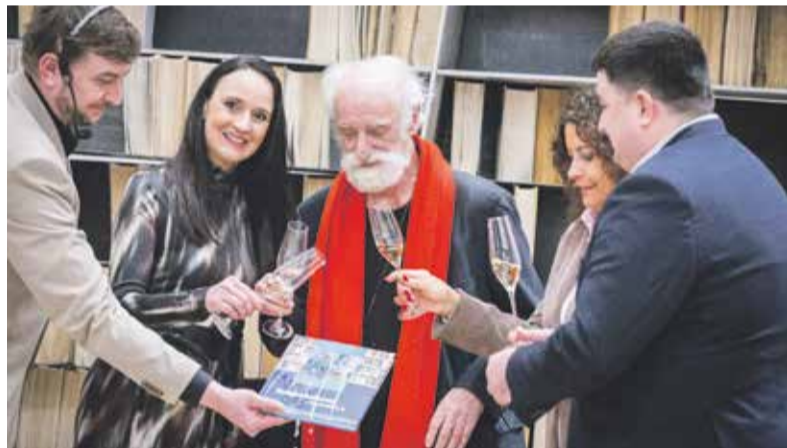
Slavnostní křest knihy se konal v rámci zahájení výstavy o knihovnách v olomouckém Červeném kostele za účasti vedení Olomouckého kraje, zástupců knihoven a s fotografem projektu Jindřichem Štreitem.