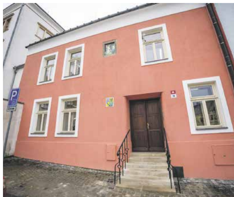
Depozitář vznikl přestavbou někdejšího hostince U Tšponů na Horním náměstí.

Pracoviště dějin školství může díky rekonstrukci nově využívat opravenou knihovnu,