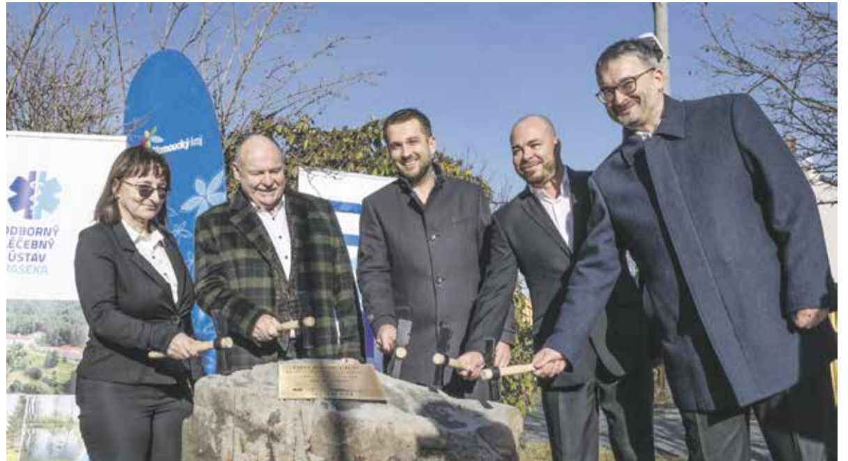
Rozsáhlá rekonstrukce léčebny v Moravském Berouně začala letos v únoru a potrvá do září 2026. Provoz zařízení bude po celou dobu zachován.

Léčebna následné péče v Moravském Berouně, která spadá pod Odborný léčebný ústav Paseka, se během následujících dvou let výrazně promění. V únoru začala modernizace více než stoleté budovy, vzniknou zde komfortní lůžková oddělení, nové technologie a špičkové zázemí nejen pro pacienty, ale také pro zdravotnický personál. „Tato rekonstrukce je klíčová pro zajištění kvalitní péče v našem regionu. Čtyřpodlažní budovu proměníme na zařízení odpovídající nejnovějším standardům zdravotní péče. Z krajského rozpočtu půjde na