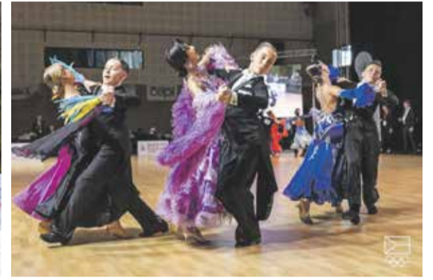
Čtyři cenné kovy přiváží mladí sportovci z Olympiády dětí a mládeže.