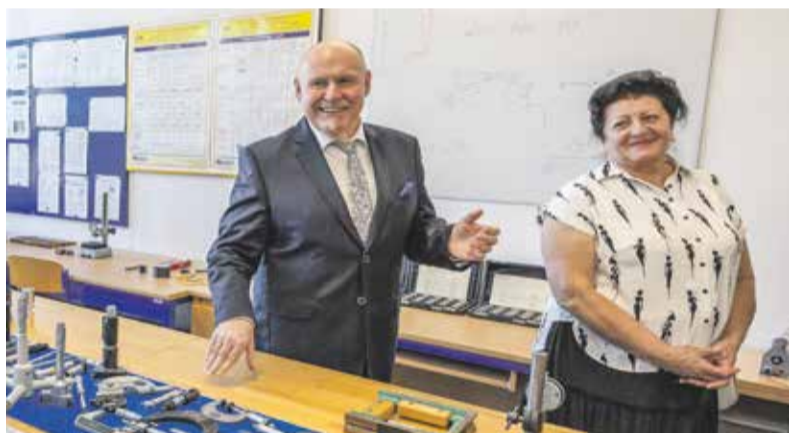
Hlavní část narozeninových oslav se uskutečnila 10. února, školu si prohlédla nejen veřejnost, ale i vedení Olomouckého kraje.

Přesně před devadesáti lety začala v Lutíně výuka učňů pro tamní Sigmundovu továrnu na čerpadla a vodní pumpy. Šikovní učni a studenti se tam se svěráky, posuvnými měřítky i CNC stroji učí pracovat dodnes a lutínská střední škola si tak letos připomíná významné výročí svojí existence.