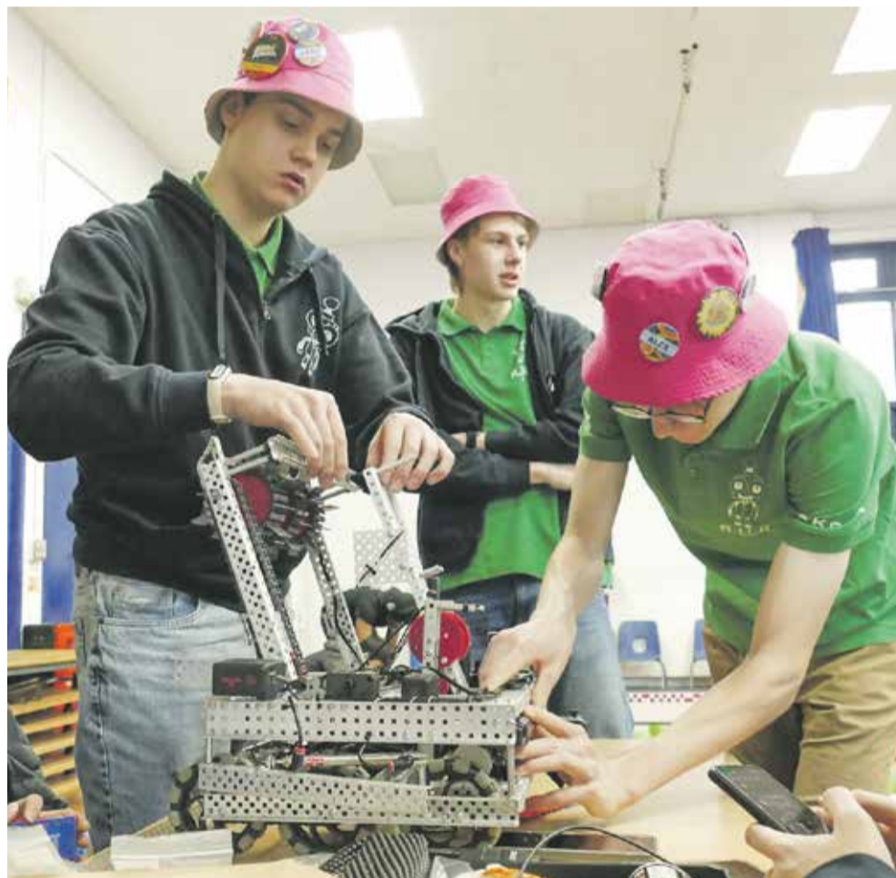
Studenti jesenického gymnázia patří ve stavbě robotů mezi nejlepší. Jejich stroje umí hrát fotbal nebo se autonomně pohybovat po zadané trase.

Zmíněné QR kódy najdou lidé už teď na některých autobusových zastávkách. Stačí na ně namířit mobilním telefonem a hned poznáte, kdy vám jede nejbližší spoj nebo kde se právě autobus, na který čekáte, nachází. Maličkost, kterou ale denně řeší mnoho lidí... Stejně jako například ztíženou dostupnost veřejné dopravy. A právě na tento problém se už vloni zaměřil projekt takzvané operativní dopravy, který probíhal v okolí Lipníku nad Bečvou. Mikrobusy jezdily do obcí a místních částí přímo na zavolání. „Projekt teď vyhodnocujeme. Jeho účelem bylo zjistit, zda a v jaké míře je operativní doprava v Olomouckém kraji životaschopná,“ uvedla ředitelka