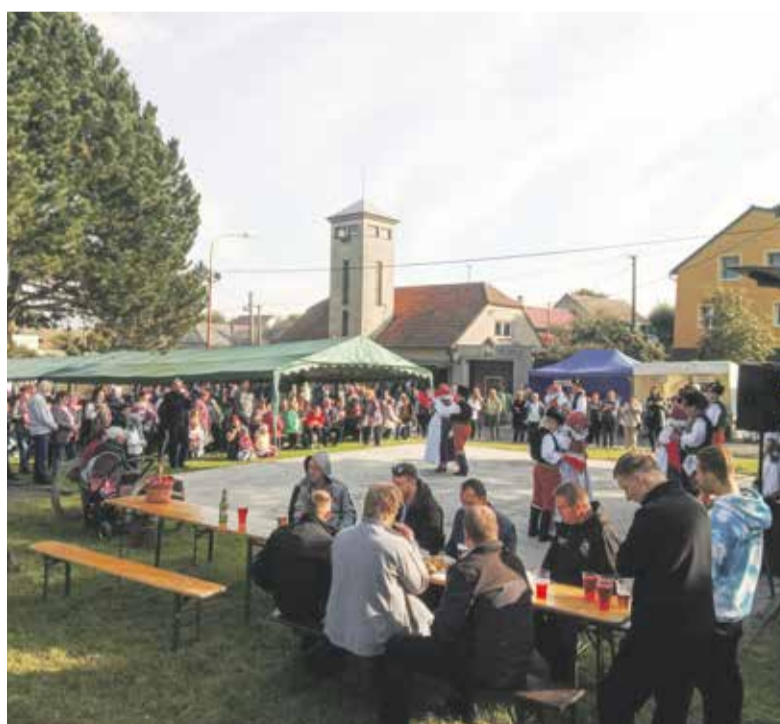
Svatováclavské hody v roce 2022.

V roce 1884 byla na návsi postavena kaple zasvěcená sv. Václavu. U cesty zvané „Napoleonka“, nad obcí směrem ke Konici, stojí malá kaplička zasvěcená sv. Liborovi. Stavba kapličky (původně boží muka dle historických pramenů z roku 1669) byla do dnešní podoby přestavěna v roce 1910 a v roce 2018 zrenovována. Sbor dobrovolných hasičů byl v obci zřízen v roce 1887 a jeho činnost trvá