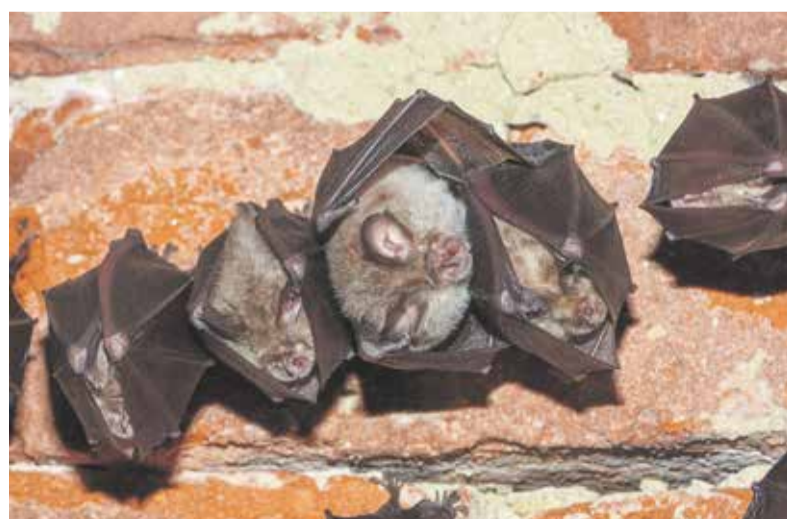
Hibernující vrápenci malí na zdech a stropěch v nepřístuných částech zámku.

Na ploše této přírodní památky a jejího ochranného pásma, které tvoří velká část zámeckého parku, bylo zjištěno celkem 15 druhů našich letounů z 27 druhů aktuálně se vyskytujících na území České republiky. Některé druhy zde