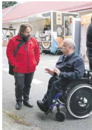
Akce Potravinové banky se zúčastnil i náměstek hejtmána Martin Škurek.

Potravinová banka v Olomouci pomáhá tisícovkám lidí v celém regionu. Shromáždí přebytečné potraviny z obchodů, od výrobců i ze zemědělství a distribuuje je prostřednictvím poskytovatelů sociálních služeb lidem v těžké životní situaci. Každoročně se také zapojuje do Národní potravinové