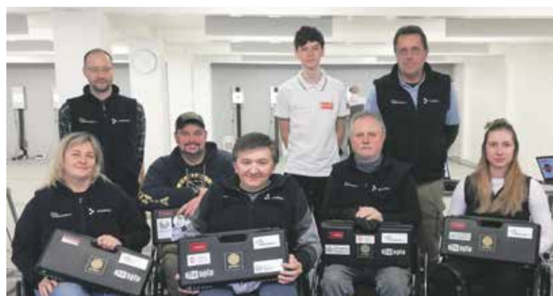
Členové sportovního střeleckého klubu ELÁN Olomouc v Hradci Králové.