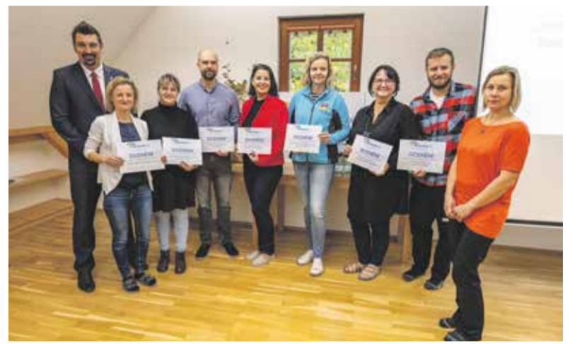
Ocenění Zelená škola Olomouckého kraje přinese vítězům finance na další rozvoj jejich aktivit.