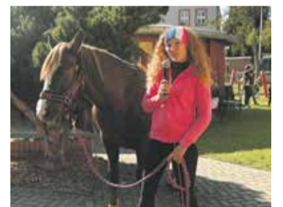
Centrum Ostrůvek otevřelo novou zahradu, uživatelům přinese prostor pro hru i aktivní odpočinek.

Centrum Ostrůvek nabízí pobytové a odlehčovací služby pro