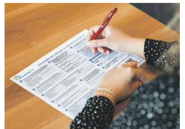
Vyhodnocení dotazníku spokojenosti přineslo cenné podněty.

Krajský úřad Olomouckého kraje tato pravidelná dotazníková šetření svých partnerů provádí systémově od roku 2023.