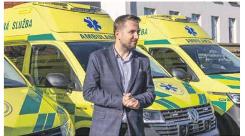
Pět nových sanitních vozů předal Zdravotnické záchranné službě Olomouckého kraje na konci října náměstek hejtmána Vladimír Lichnovský.

Lékaři zdravotnické záchranné služby, kterou zřizuje Olomoucký kraj, budou nově k pacientům pospíchat v dalších moderních sanitkách. Šest jich hejtmanství předalo záchranářům letos na jaře a dalších pět ve čtvrtek 30. října. Pořízení automobilů vyšlo na dvaadvacet milionů korun. Celou objednávku nové techniky platil kraj za své, tedy bez cizích dotací.