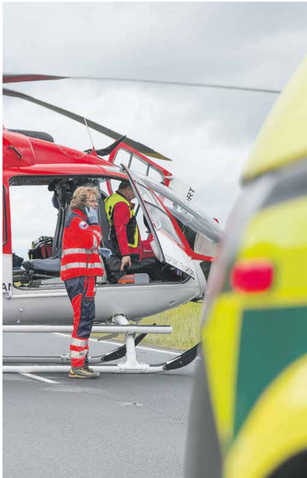
Olomoucký kraj je pro potřeby záchranné služby rozdělen do pěti územních odborů, ty čítají dohromady 17 výjezdových základen.

Dalším novým dotačním programem v oblasti zdravotnictví jsou stipendia pro