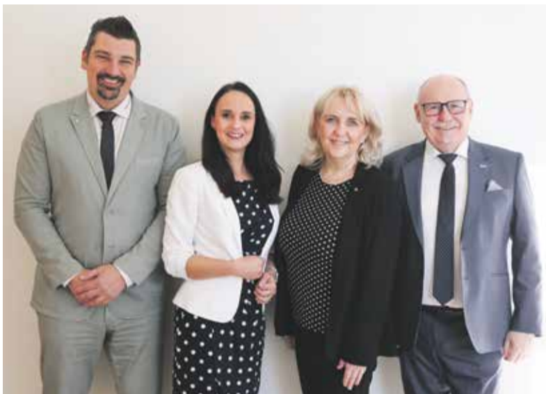
Také členové vedení Olomouckého kraje podpořili pacienty s lupénkou.

Olomoucký kraj letos patří mezi jedny z důležitých podporovatelů šestého ročníku Puntíkového dne. Ten upozorňuje na řadu mýtů a dezinformací, které se poji s lupénkou. V Česku trpí touto nemocí více než čtvrt milionu lidí.