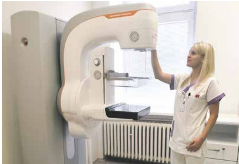
Nový mamograf v Jeseníku rozšíří nabídku lékařské péče na severu kraje.

„Souhlas ministerstva je pro nás zásadním milníkem. Umožňuje nám nyní jednat se zdravotními pojišťovnami o nasmlouvání preventivní mamografické péče,