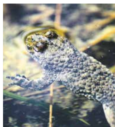
Kuňka žlutobřichá.

Pro podporu místní populace obojživelníků zde Odbor životního prostředí a zemědělství