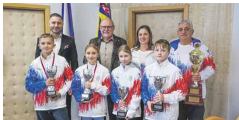
Bronz z dopravní soutěže v srbském Bělehradu získali školáci z Medlova.

Žáci ze základní školy Medlov vybojovali třetí místo v evropském