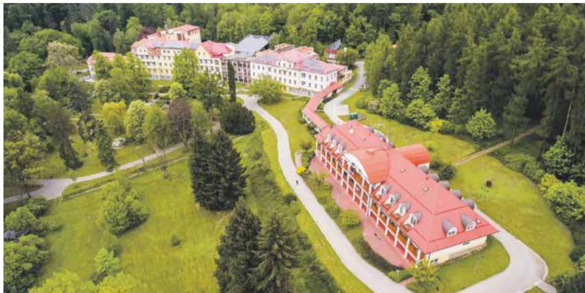
Modernizace a přestavba prostorů pro pacienty v Odborném léčebném ústavu Paseka jsou v plném proudu.

požadovanou ve zdravotnictví pro následnou péči o pacienty. Takže nové budou pokoje, vybavení, všechny příslušné technologie, ale vylepšíme i prostor pro náš personál. Navíc přibude nová kavárna, kde si budou moci pacienti i jejich návštěvy posedět, a plánujeme také vybudování kaple.