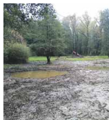
Obnova tůň.

Krajského úřadu Olomouckého kraje jako správce památky prostřednictvím Mgr. J. Maštery a společnosti ADAPTO.space