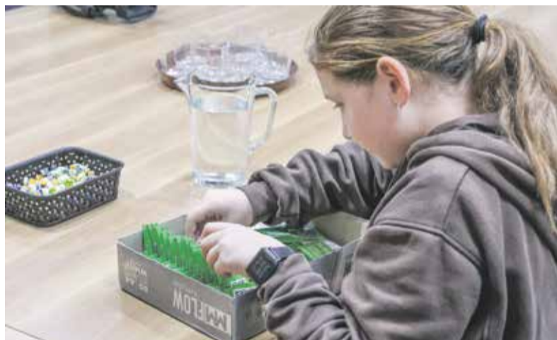
Koupí zeleného kolíčku podpořili lidé Nadaci Jedličkova ústavu.

Každý zakoupený kolíček pokryje náklady na dvacet minut osobní asistence pro hendikepované lidi. Kolíčkový den připadá oficiálně na středu 22. října, v budově Olomouckého kraje se ale kolíčky prodávaly ještě i v pátek.