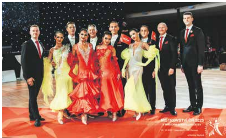
Taneční klub Olymp Olomouc získal cenné medaile ve standardních i latinskoamerických tancích.