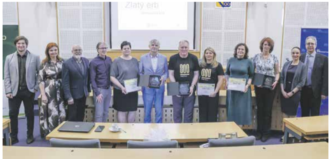
Zlaté Hory letos ovládly krajské kolo soutěže Zlatý erb, která každoročně oceňuje nejlepší webové stránky měst a obcí. Druhé místo patří Velkému Týnci, třetí příčku obsadily Loštice. V Olomouckém kraji se do 27. ročníku přihlásilo šestnáct obcí bez rozšířené působnosti. Hodnotila se přehlednost, technická úroveň, nabídka online služeb i grafické zpracování. Nově se porotci zaměřili také na přístupnost webových stránek pro všechny uživatele. Vítěz krajského kola postupuje do celostátního finále.