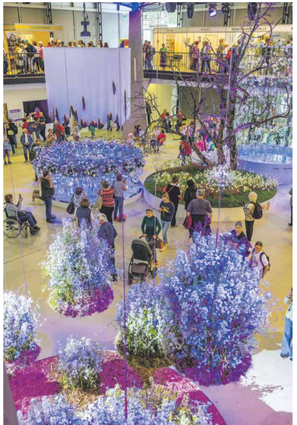
Poslední dubnový víkend hostilo olomoucké výstaviště jarní etapu výstavy Flora Olomouc, která každoročně přivádí do hanácké metropole tisíce milovníků květin a zahradničení. Letošní ročník s názvem Paralelní květy ukázal návštěvníkům výjimečné propojení květinového umění a sklářské tvorby. Hlavní expozici v pavilonu A vytvořil mezinárodně uznávaný slovenský florista Róbert Bartolen, který se zaměřil na harmonii květin a skla.