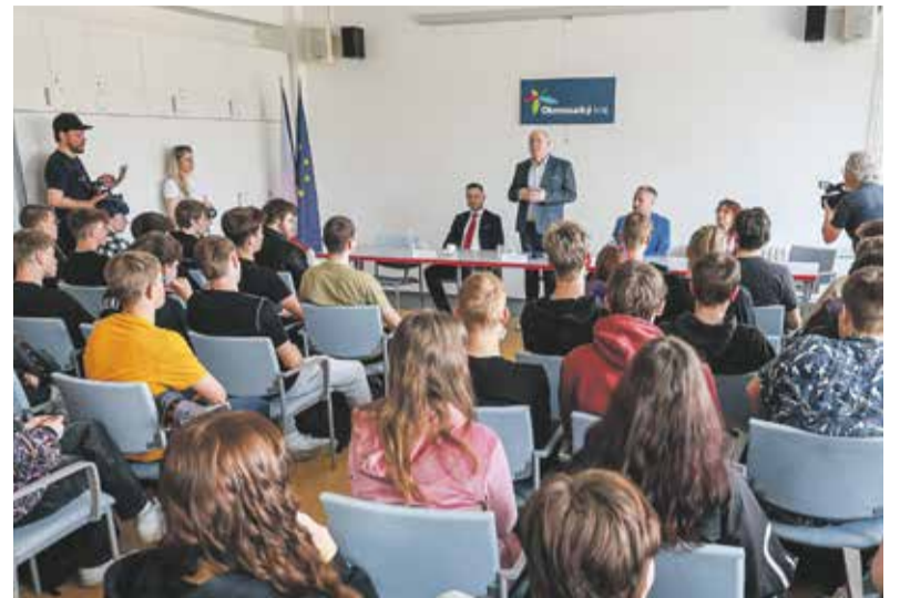
Vedení Olomouckého kraje pravidelně vyjíždí do měst a obcí, aby přímo v terénu diskutovalo s místními o jejich potřebách.

Vedení kraje navštívilo například papírnu v Olšanech, diskuze s dalšími podnikateli se