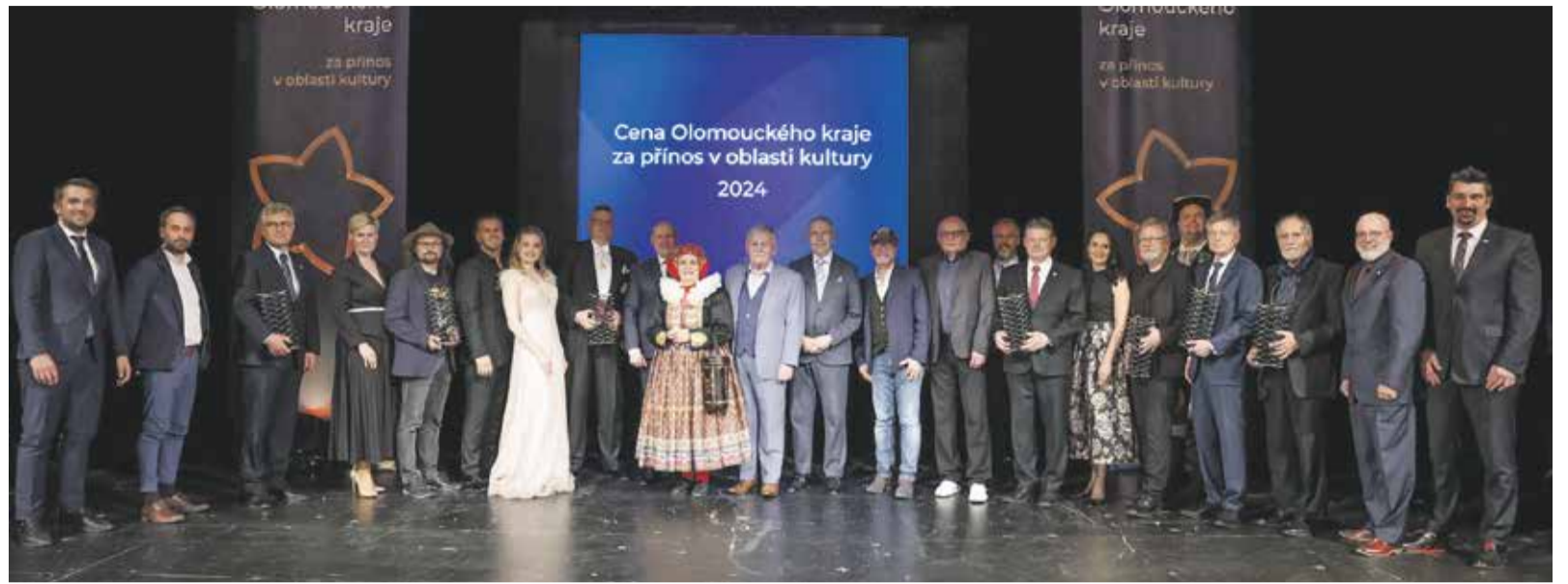
Předávání cen za kulturní počiny se konalo na konci dubna v olomouckém Moravském divadle.

Cenu veřejnosti Olomouckého kraje si tentokrát odnesl mezinárodní hudební festival Keltská noc. Akce s tradicí od roku