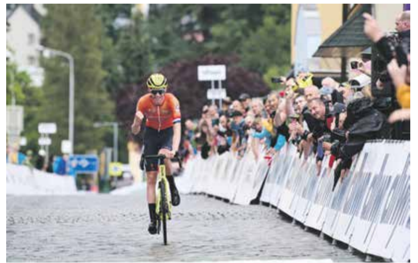
Trasa Závodu míru je lemována fanoušky cyklistiky.

Peloton se představí na známých místech, podoba etap se oproti loňsku ale opět liší. Hned na úvod čeká jezdců etapa z Krnova do Šternberka