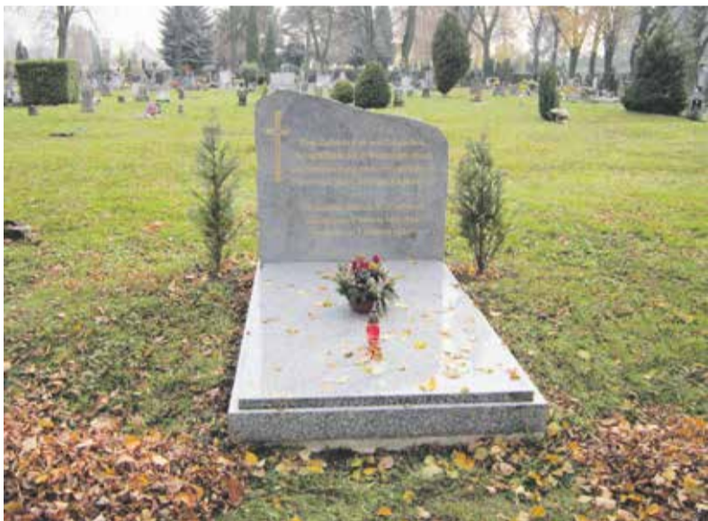
Památník zemřelých Němců v květnu 1945 ve Šternberku (stojí na místním hřbitově).