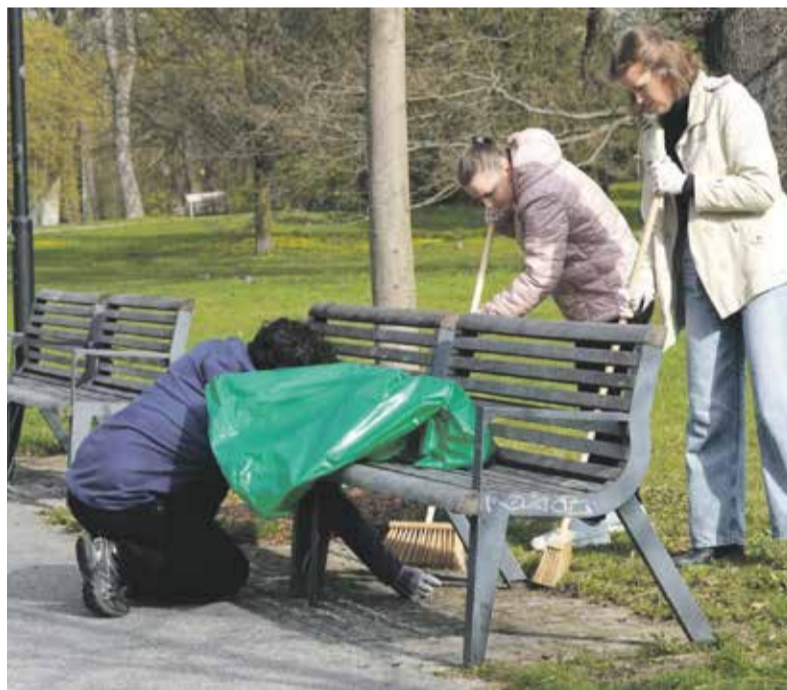
Zhruba tři sta studentů v rámci dobrovolnického dne pomáhalo s úklidem a údržbou v areálech sociálních služeb.