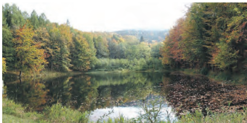
Černé jezero u Zlatých Hor na Jeseníku.

Černé jezero však není jen rájem pro obojživelníky – skrývá i další přírodní poklady. Najdete zde soustavu vodních ploch – Horní a Spodní jezero