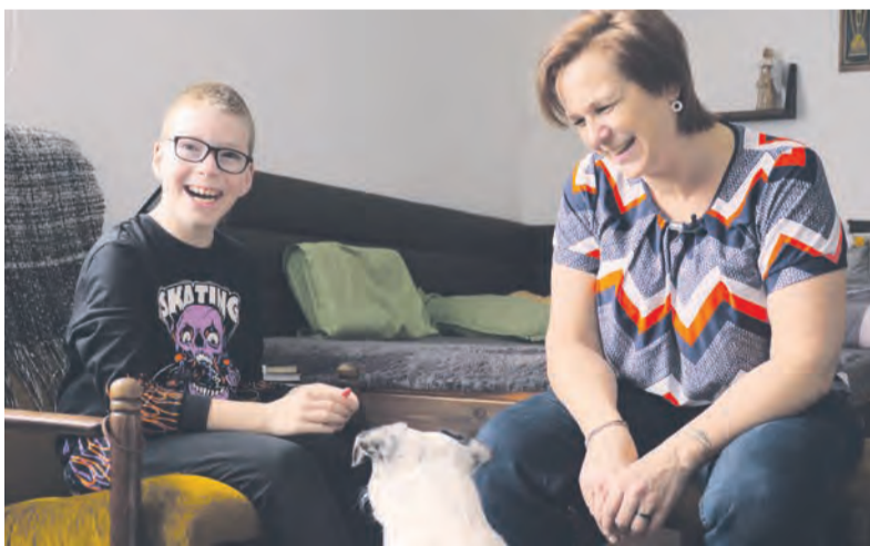
Homesharing v praxi.