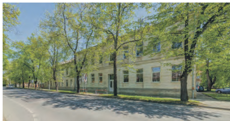
Historická budova je více než sto let stará a po kompletní rekonstrukci bude bezbariérová.

Proměnu čekají inženýrské sítě, terénní úpravy v areálu a využívána bude i dešťová voda