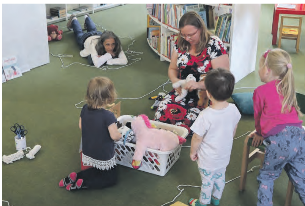
Odborníci ze Střediska sociální prevence pracují nejen s dospělými, ale pomáhají i dětem překonat nesnáze, které život přináší.

Ladislav Okleštěk, váš hejtman Olomouckého kraje