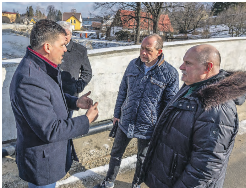
Podrobnosti o tom, jak peníze získat, oznámili představitelé krajů a Ministerstva pro místní rozvoj v České Vsi na Jesenícku, a to v úterý 18. února.

Do programu ŽIVEL 3 se mohou zájemci hlásit výhradně