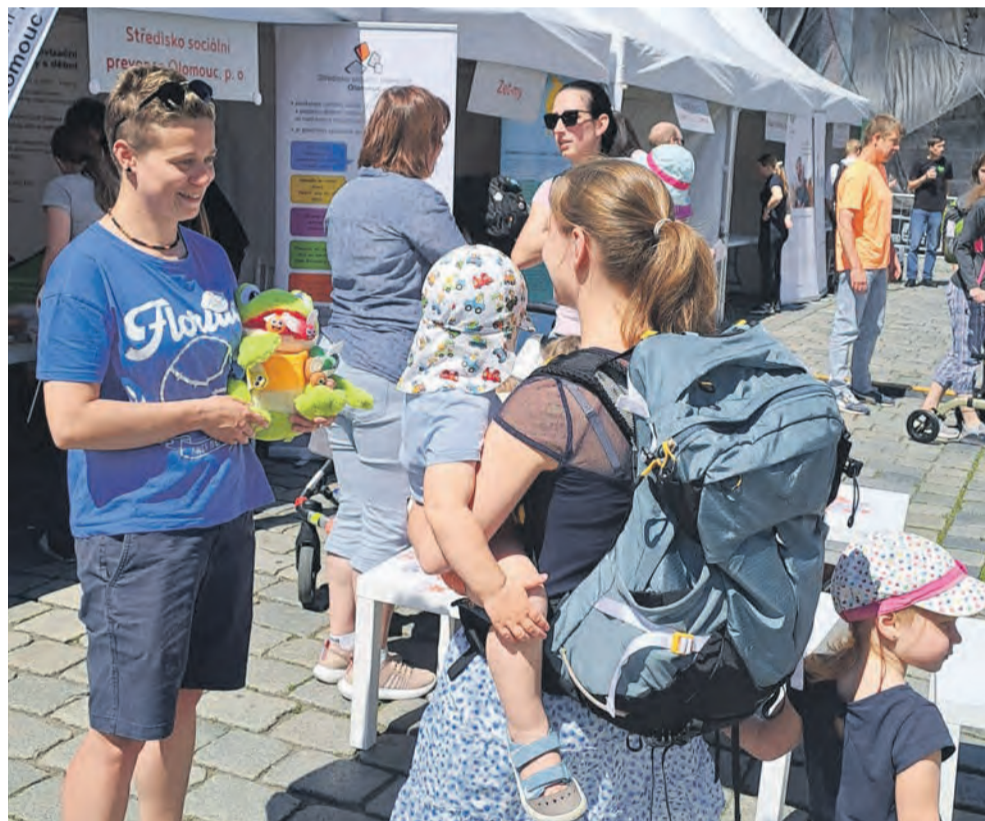
Středisko sociální prevence Olomouc nabízí širokou škálu aktivit a preventivních programů. Jejich nabídku představuje v průběhu různých akcí přímo na ulici.