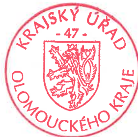
otisk úředního razítka

Proti tomuto rozhodnutí lze podat odvolání do 15 dnů ode dne oznámení tohoto rozhodnutí k Ministerstvu vnitra podáním učiněným u Krajského úřadu Olomouckého kraje. Lhůta pro odvolání se počítá ode dne následujícího po doručení rozhodnutí.