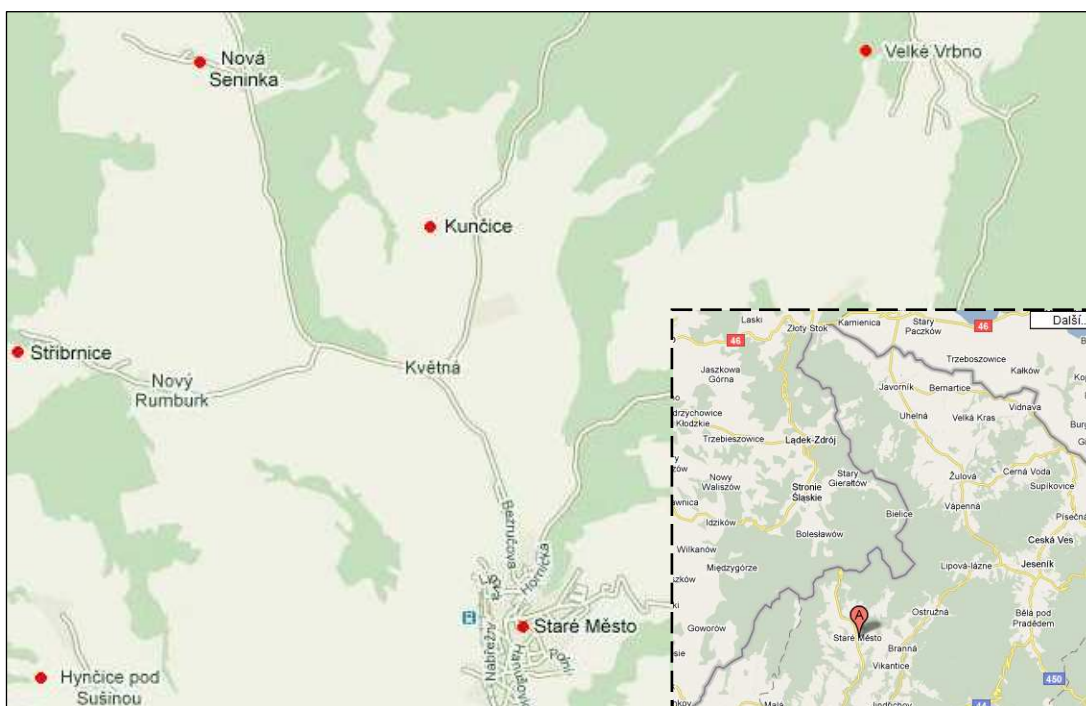
Obrázek 1 – Mapa obce Staré Město (včetně jednotlivých částí obce)

Město si zachovalo původní středověký půdorys s řadou památkových objektů, je také jednou z nejvýznamnějších archeologických lokalit České republiky – svou rozlohou patří k největším sídlištím Velkomoravské říše.